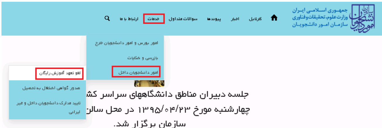
تصویر ۱ - نمایش پرتال

از طریق پورتال سازمان امور دانشجویان و از سربرگ خدمات، بخش امور دانشجویان داخل را انتخاب کرده و سپس در این قسمت جهت ثبت درخواست بر روی لغو تعهد آموزش رایگان کلیک نمایید. (تصویر 1)